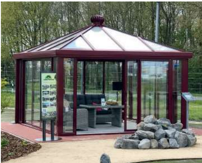
Teehaus RAL 3005 weinrot