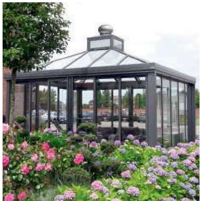
Sonderkonstruktion mit Dom und Windradlüfter

Modell 4-eckig, mit geraden Dachsprossen, Größe: 4,00 x 4,00 m, Stehwandhöhe: 2,10 m inkl. 3 x Mehrfach-Schiebetüren 3-tlg. inkl. integrierter Regenrinne mit 2 Fallrohren inkl. Windradlüfter Alu-Konstruktion: Standard-Farbe nach RAL grün 6009, weiß-aluminium 9006, anthrazitgrau DB703 Verglasung: ISO-Sicherheitsglas 2 x ESG 4 mm / Dach mit VSG (ISO-Verbund-Sicherheitsglas)