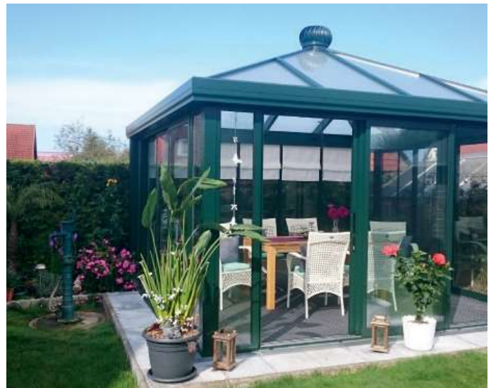
Teehaus RAL 6009 tannengrün